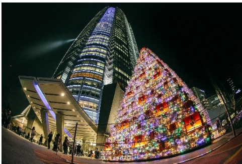
イルミネーションを美しく、面白くとらえて