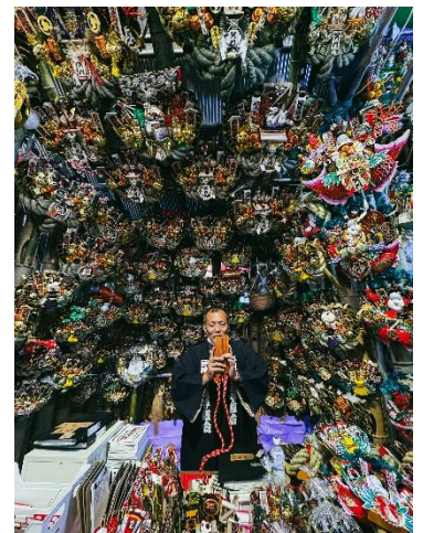
臨場感あふれるダイナミックな構図を

* 教材・持ち物・カリキュラムの内容は予告なく変更する場合がございます。 * 受講生が一定数に達しない場合等、やむをえず教室の開講を中止する場合がございます。