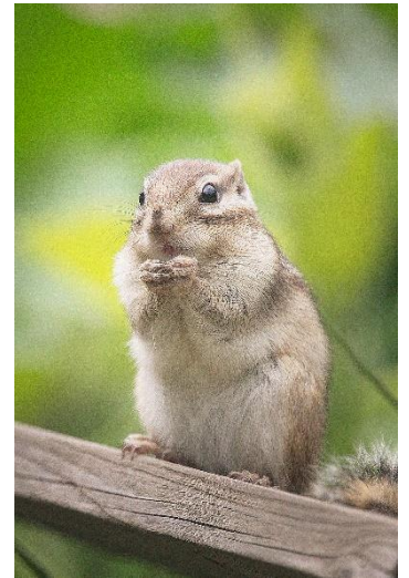
絞りをコントロールして一瞬の表情を捉える

*教材・持ち物・カリキュラムの内容は予告なく変更する場合がございます。 *受講生が一定数に達しない場合等、やむをえず教室の開講を中止する場合がございます。