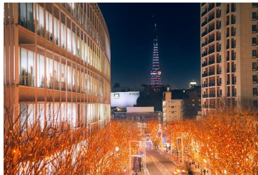
光と影が織りなす色鮮やかな夜景写真を