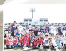
ラクロス教室 公益社団法人ラクロス協会