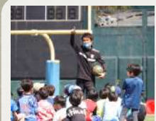
サッカー教室 川崎フロンターレスクール・普及コーチ