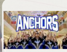
チアリーディング教室 ANCHORS