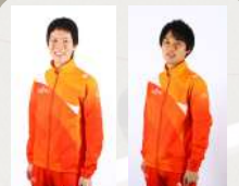
歩き方教室 鈴木雄介選手/高橋英輝選手