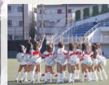
チアダンス教室 フロンティアレッツ