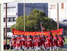
アメフト教室 富士通フロンティアース