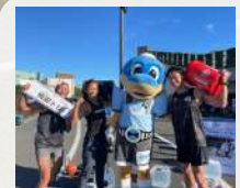
親子障害物レース Spartan SGX Japan