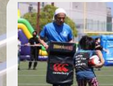
ラグビー教室 川崎市ラグビーフットボール協会