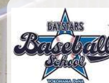
ベースボールスクール体験 横浜DeNAベイスターズ