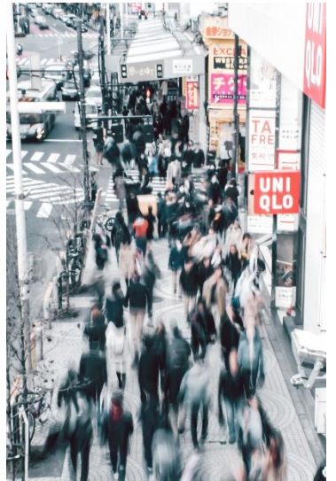
シャッタースピードの設定を利用して

*教材・持ち物・カリキュラムの内容は予告なく変更する場合がございます。*受講生が一定数に達しない場合等、やむをえず教室の開講を中止する場合がございます。