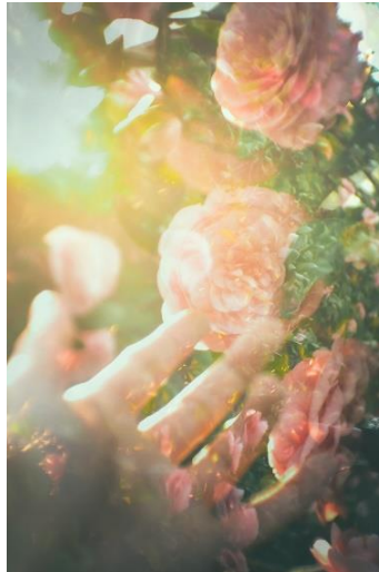
光が織りなす幻想的な世界