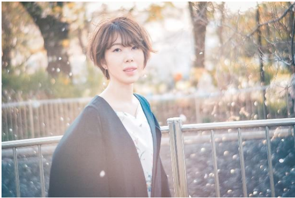
思い出の一頁を鮮やかに残すために