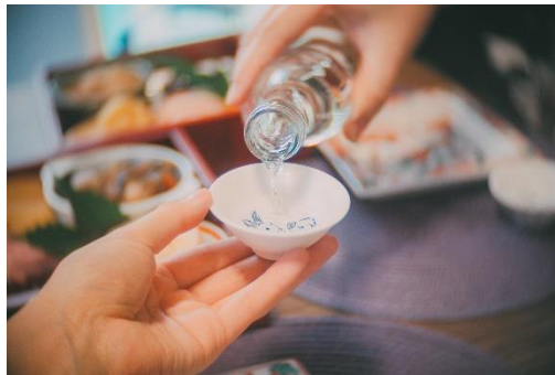
食事時のなにげないひとコマを