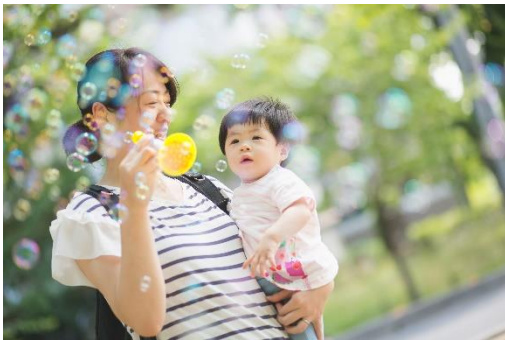
シャボン玉の柔らかな表情を捉えて