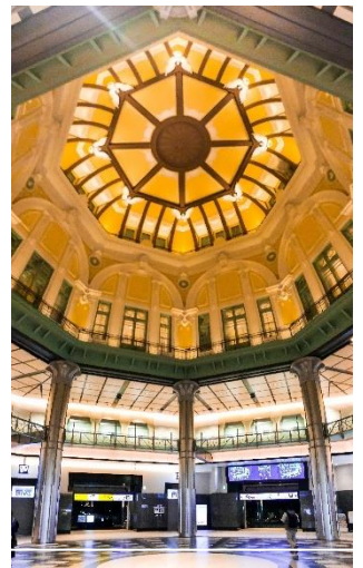
日常に出会う感動を切り取って

*教材・持ち物・カリキュラムの内容は予告なく変更する場合がございます。*受講生が一定数に達しない場合等、やむをえず教室の開講を中止する場合がございます。