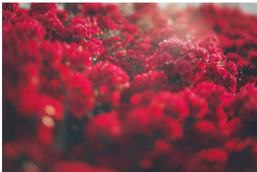
一味違った花のある風景