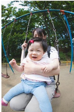
レンズの特性を活かした撮影も