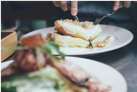
インスタ映える食事の写真