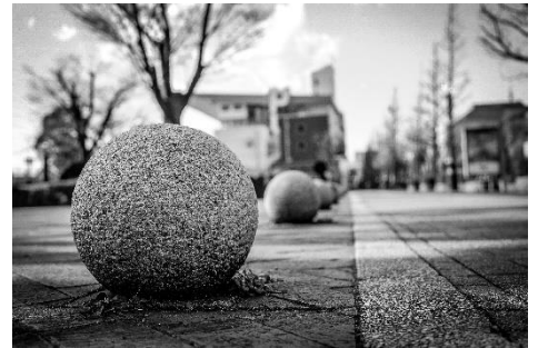
なにげない日常も新しい視点で