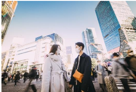
シャッタースピードを利用した街中シーンの切り抜き