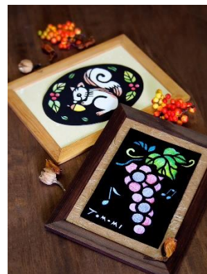
《作品イメージは秋のモチーフの切り絵です》

* 教材・持ち物・カリキュラムの内容は予告なく変更する場合がございます。詳しくは <カルッツかわさき> までお問い合わせください。