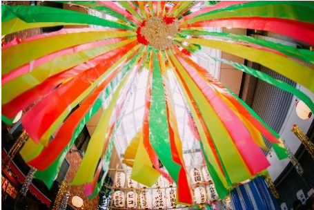
特徴的なアングルで