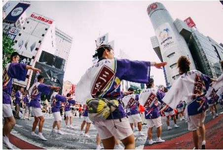
ダイナミックな躍動感を伝える