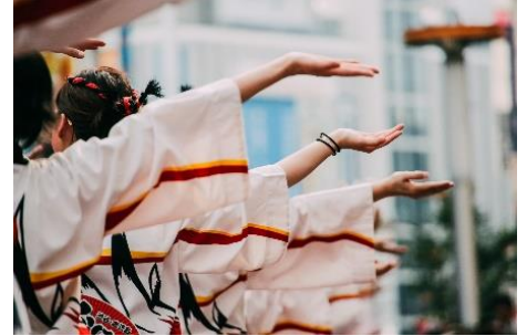
景色の効果的な切り取り方