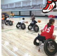
車椅子バスケならではの楽しさ、難しさを実感しよう!!