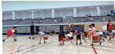
ボールコントロールから正しいシュートの姿勢まで楽しくしっかり基本をマスター!!

川崎スポーツパートナーのスペシャルレッスンでバスケの楽しさを学んだ後は川崎 WSC の選手と車椅子バスケに挑戦!