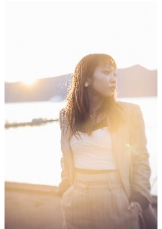
人物写真の切り取り方