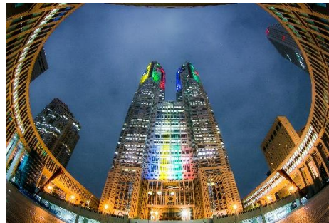
個性的なのアングルの写真