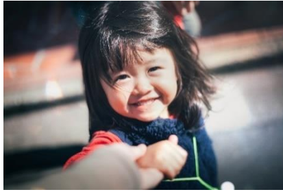
お子さんの表情にフォーカスして