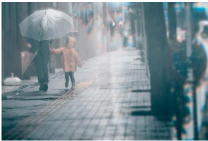
雨の日の一瞬を切り取って