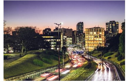
夜景と動きのある写真

*教材・持ち物・カリキュラムの内容は予告なく変更する場合がございます。詳しくは <カルツかわさき> までお問い合わせください。